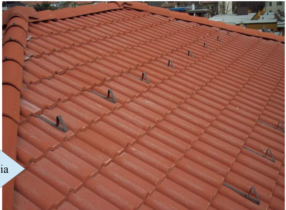
Tegola doppia romana liscia