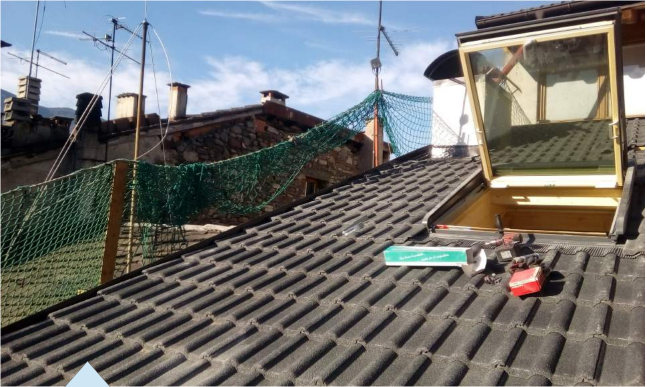
Tegola doppia romana granulata