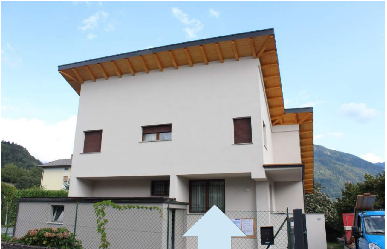
Gronda perimetrale vista dall'esterno