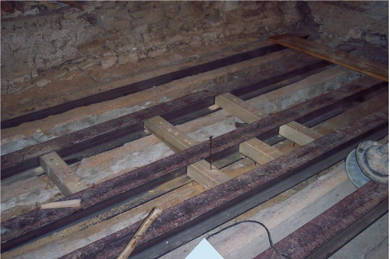
Rifacimento di un solaio