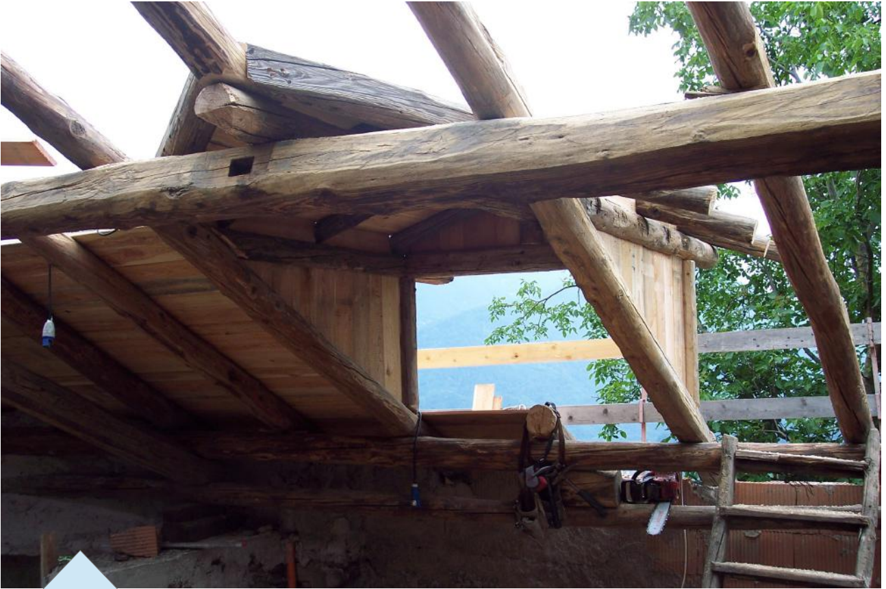
Abbaino in rifacimento