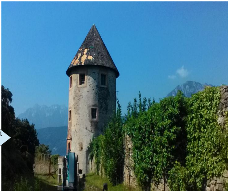
Manutenzione alla torre tonda (castello di Pergine)