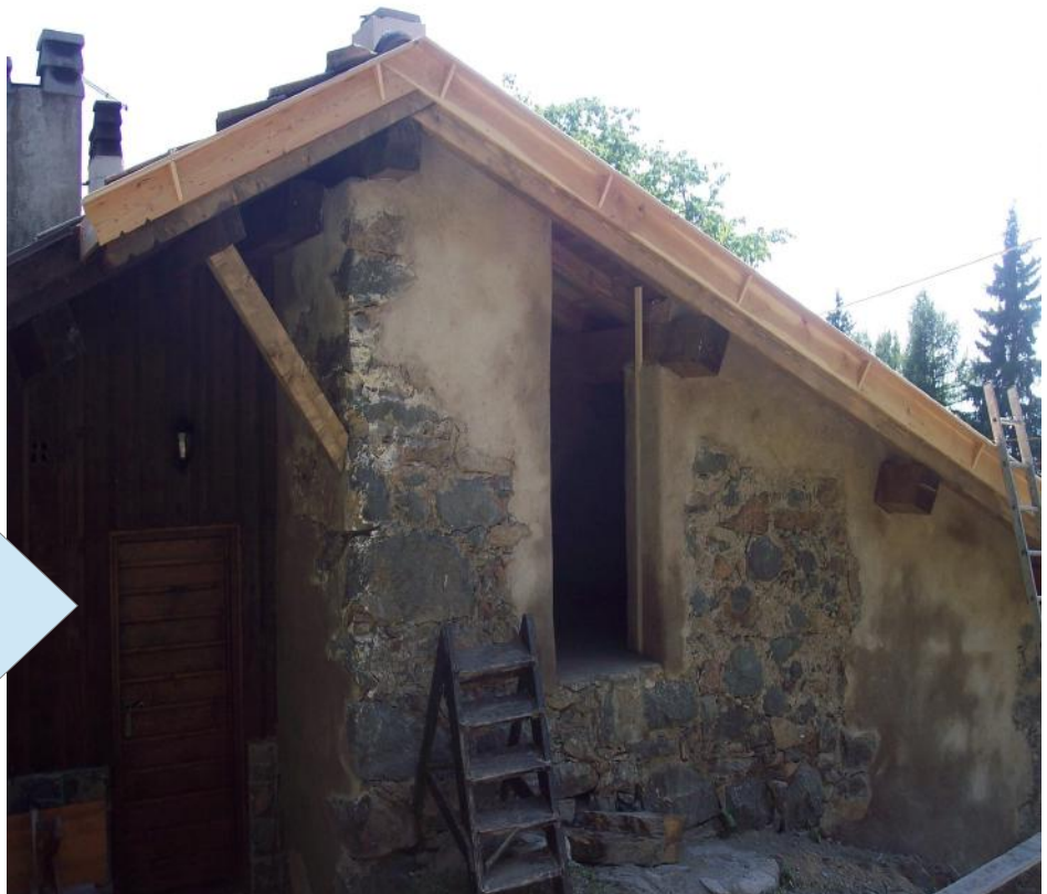
Mantovane in larice